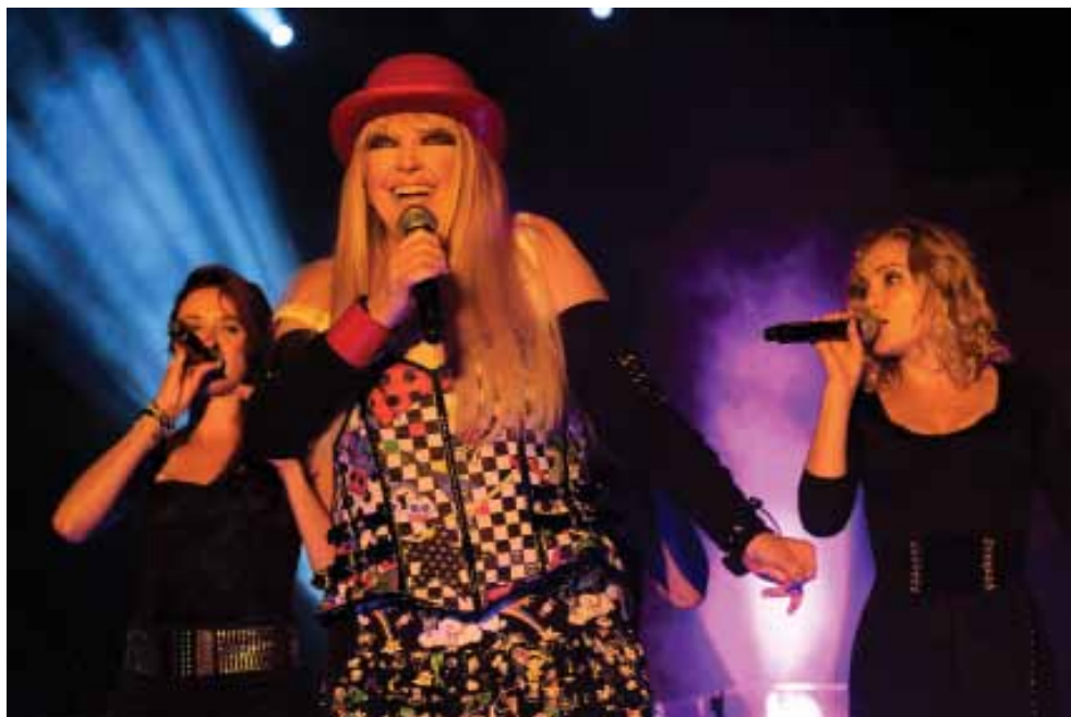
☐ Niezniszczalna, niezatapialna, niezastąpiona caryca Maryla Rodowicz. Na każdym koncercie w innym stroju i z innymi piosenkami. Zamość 2012.

Oczywiście w takiej chwili publiczność wykrzykuje wszystkie znane tytuły piosenek Maryli: Małgośka , Remedium (czyli „Wsiąść do pociągu”), Sing-Sing , Niech żyje bal itp. Jest tego tyle, że czasami nawet trudno wyłowić uchem, co dokładnie ludzie wołają, bo choć krzyczą bardzo głośno, to każdy chce usłyszeć co innego i każdy woła po swojemu. Rodowicz staje wtedy na skraju wybiegu (też ma własny, ze specjalnym oświetleniem) i spokojnym głosem stara się odpowiadać: