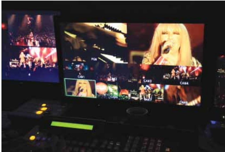
☐ Taki widok z kilku kamer ma przed sobą nasz realizator wizji. Od 2013 roku wszystkie koncerty są transmitowane w internecie. Szczegóły na latozradiem.pl

Przyspieszając konkursy, udało nam się minimalnie nadgonić czas. Nie była to jednak wielka zmiana. Deszcz cały czas padał, choć akurat na samym początku występu Rodowicz jakby trochę osłabł. Nasza gwiazda, nie zważając na warunki, wyszła w nowej pięknej kreacji i zaczęła śpiewać. Ochrona dygotała z zimna. Muzycy walczyli z rozstrajającymi się od zimna instrumentami. Światła z trudem przebijały się przez wodną mgiełkę, a może już przez górską mgłę? W efekcie pod samą sceną widać było tylko ciemne, zmoczone od wielogodzinnego stania kaptury fotoreporterów, a dalej las otwartych parasolek trzymany przez publiczność. Wszystko było w miarę dobrze do piątego utworu. W połowie Remedium najpierw zerwał się silny wiatr, a chwilę później nad stadion nadciągnęła ściana deszczu. Dosłownie przestaliśmy cokolwiek widzieć.